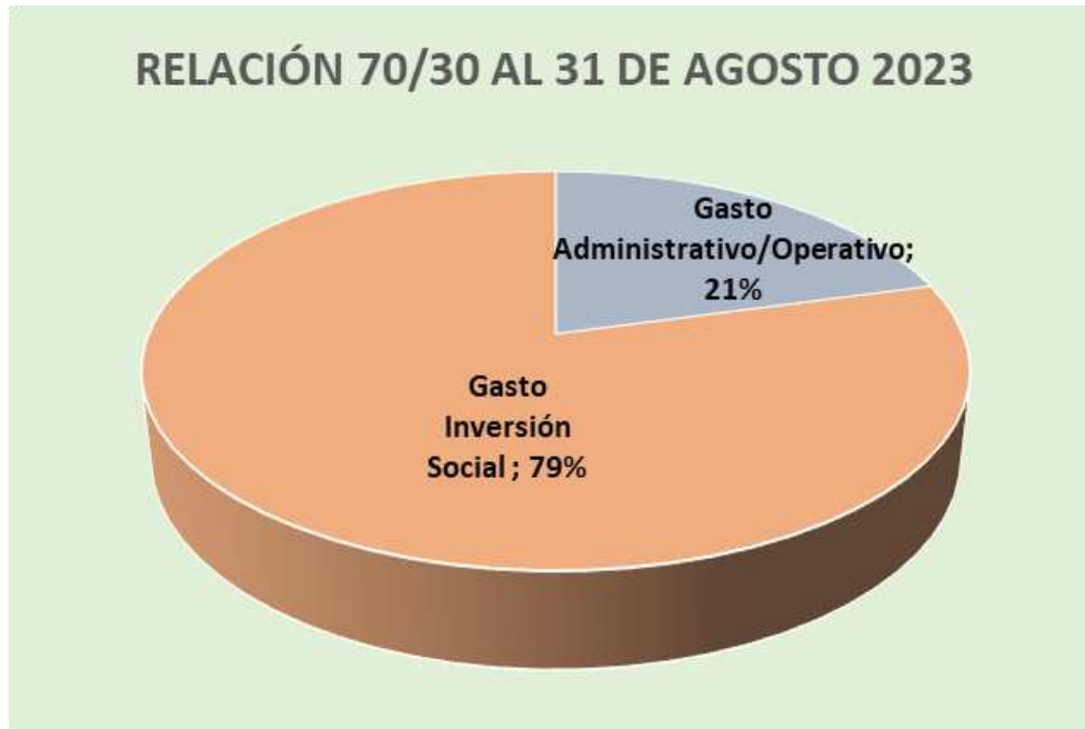
Gráfico No. 2 RELACIÓN 70/30 CIFRAS EN TÉRMINOS RELATIVOS

Para concluir con el análisis de la ejecución de los recursos presupuestados a la fecha, se hace necesario determinar el Superávit Real con el cual la institución finalizó el mes de agosto del período 2023, para tal fin se presenta la siguiente información: