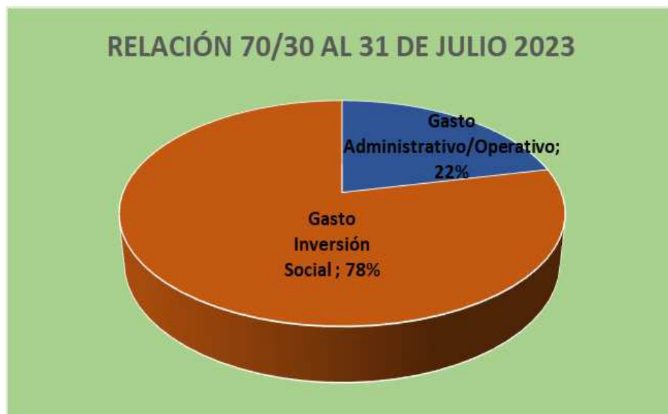
Gráfico No. 2 RELACIÓN 70/30 CIFRAS EN TÉRMINOS RELATIVOS

Para concluir con el análisis de la ejecución de los recursos presupuestados a la fecha, se hace necesario determinar el Superávit Real con el cual la institución finalizó el mes de julio del período 2023, para tal fin se presenta la siguiente información: