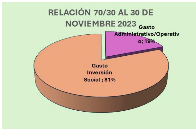
Gráfico No. 2 RELACIÓN 70/30 CIFRAS EN TÉRMINOS RELATIVOS

Para concluir con el análisis de la ejecución de los recursos presupuestados a la fecha, se hace necesario determinar el Superávit Real con el cual la institución finalizó el mes de noviembre del período 2023, para tal fin se presenta la siguiente información: