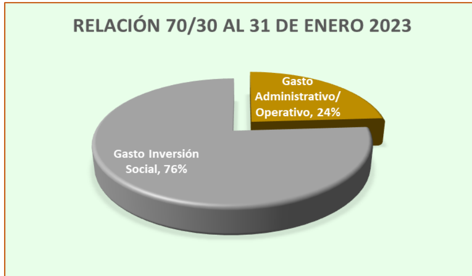
Gráfico No. 2 RELACIÓN 70/30 CIFRAS EN TÉRMINOS RELATIVOS

Para concluir con el análisis de la ejecución de los recursos presupuestados a la fecha, se hace necesario determinar el Superávit Real con el cual la institución finalizó el mes de enero 2023, para tal fin se presenta la siguiente información: